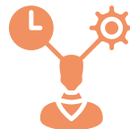
Visión sistemática y transorganizacional del rol